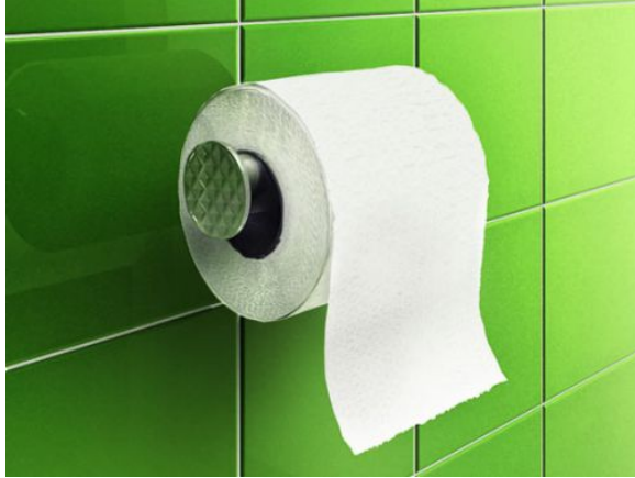
Papel Jumbo y de baño