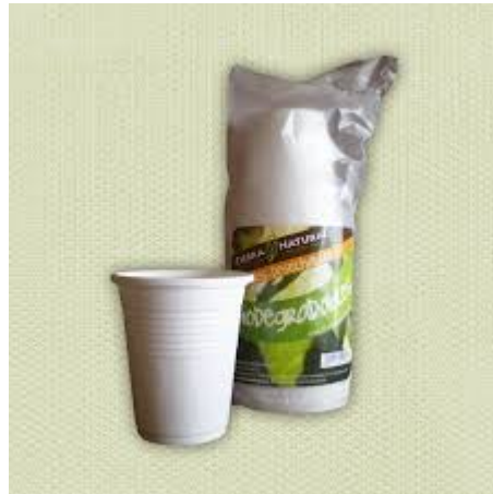
Vasos Bebida Fría y Caliente