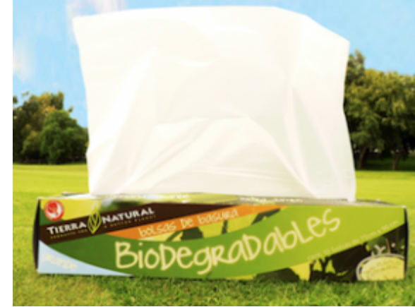
Bolsas de Basura