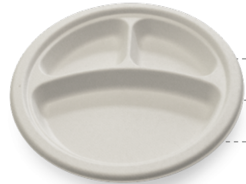
Contenedores y platos.